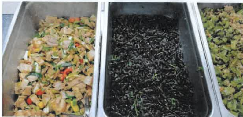
每日餐食-四色一湯