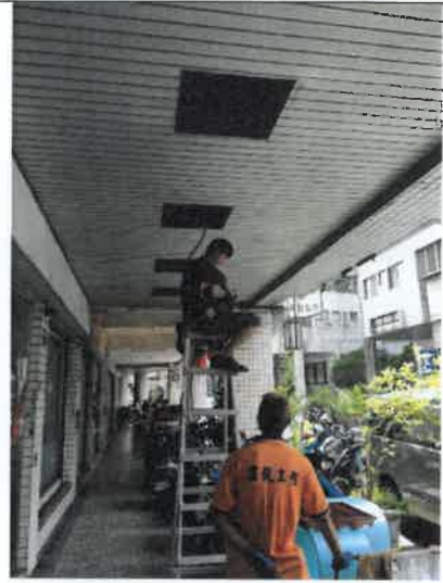
露德家園室內線路整修工程