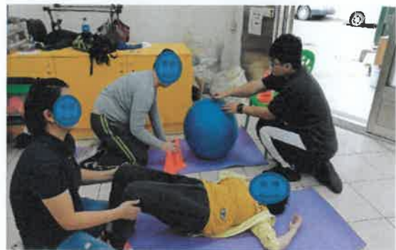
每月物理治療課程