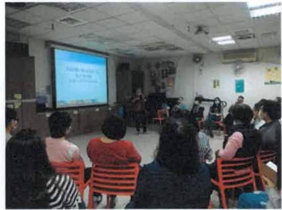
員工教育訓練費課程