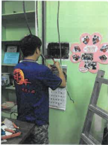
露德家園室內線路整修工程