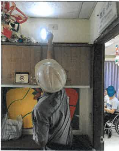
緊急電源配線工程