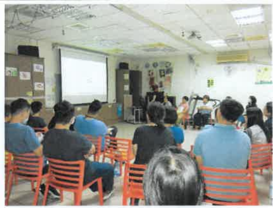
員工教育訓練費課程