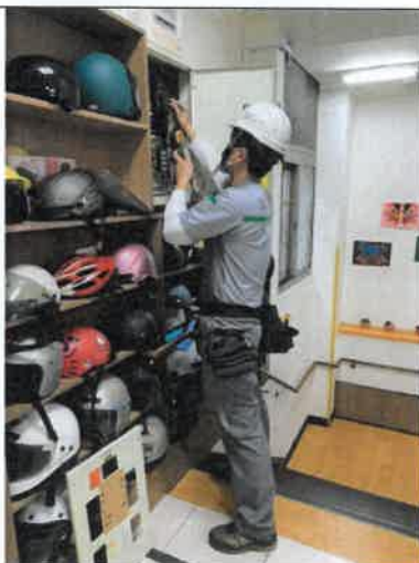
匯流排開關專用迴路檢修