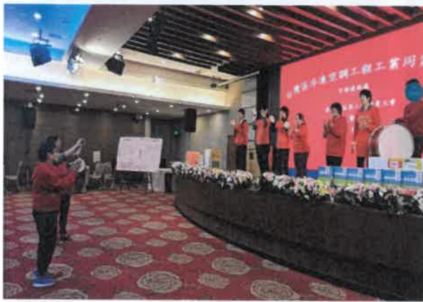
打擊樂參加對外表演