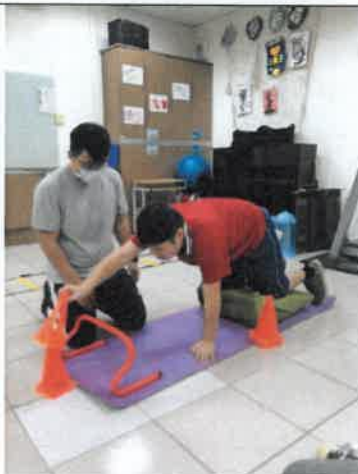
每月物理治療課程