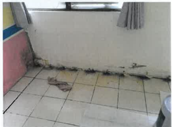
露德家園防水工程