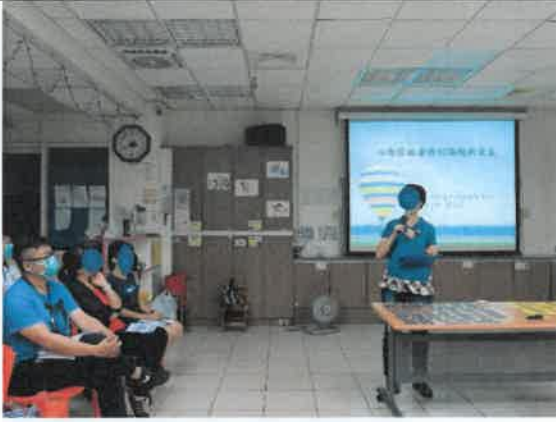
員工教育訓練費課程