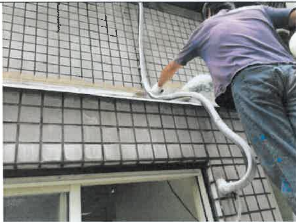
露德家園防水工程