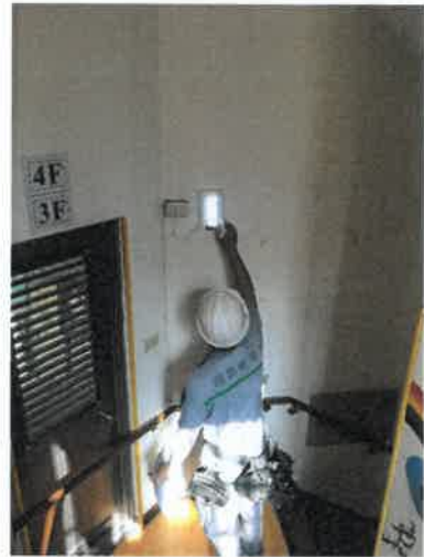
緊急電源配線工程