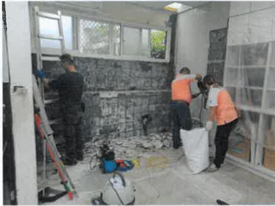
露德家園地板等拆除工程