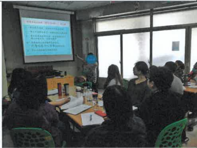
員工教育訓練費課程-教保團督