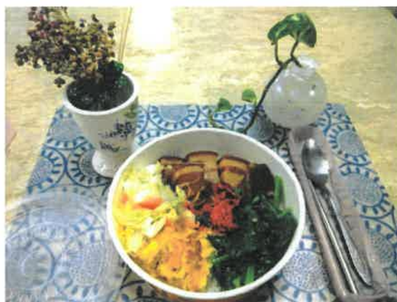
每日餐食-主食+三菜一湯