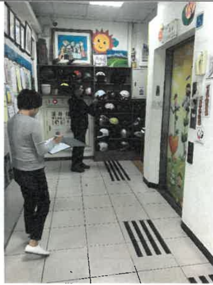
108年12月13日 結構技師拍照勘查地形