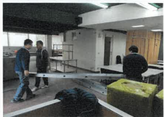
108年12月6日 日間作業所施工