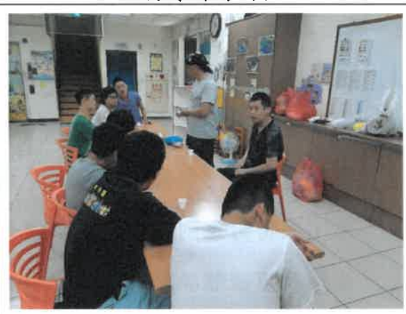
108 年 9 月 15 日 媒材課程