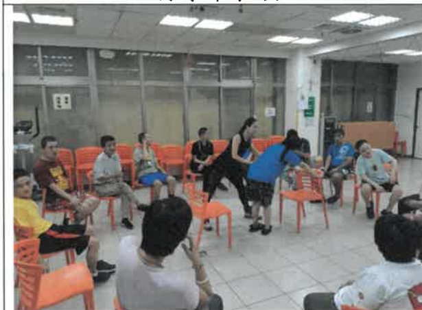
108 年 9 月 25 日 舞蹈課程