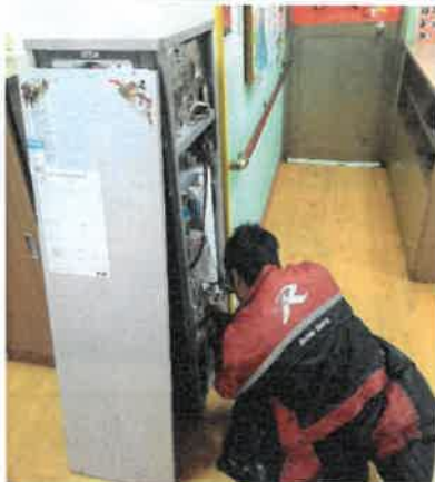
108年8月13日 飲水機裝修