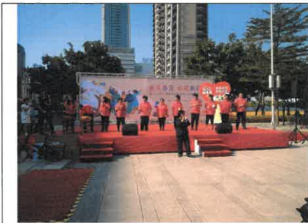
108 年 12 月 1 日 打擊樂表演