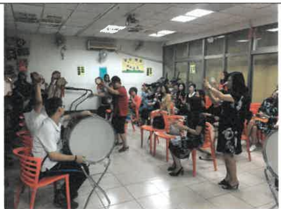
108 年 9 月 15 日 打擊樂表演