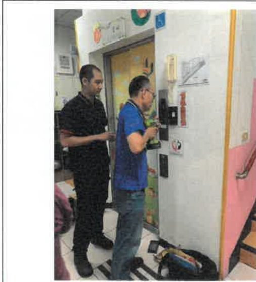
108年8月20日 電梯安裝刷卡機