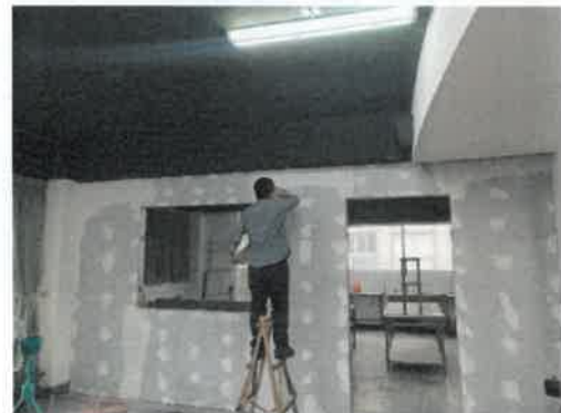
108年12月6日 日間作業所施工