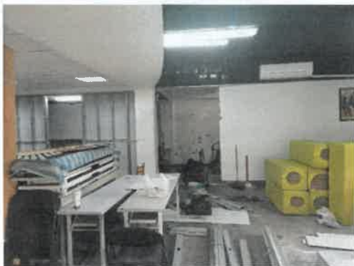
108年12月6日 日間作業所施工